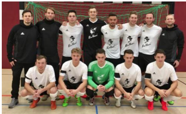
Das neuformierte SFV-Team überzeugte in Bad Blankenburg.